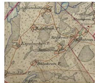
Lantmäteriet 1890. Utsnitt.